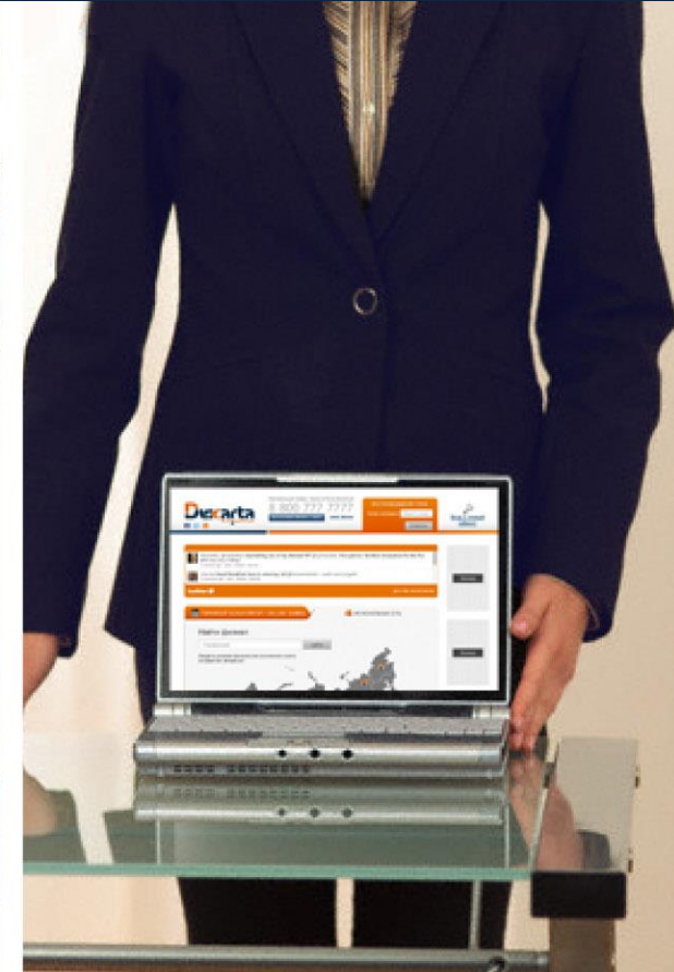
IT - платформа